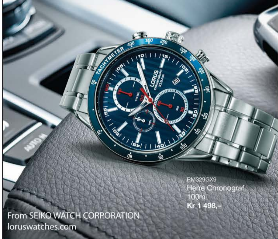
RM329GX9 Herre Chronograf 100m Kr 1 498,-

From SEIKO WATCH CORPORATION loruswatches.com