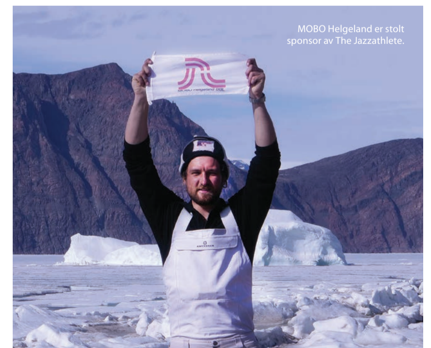
MOBO Helgeland er stolt sponsor av The Jazzathlete.

Fjelltoppene har mangler for å fullføre The Seven Summits, tenker han å ta innimellom polene eller når det ellers måtte passe med tanke på pandemien og andre forhold som vær og tillatelser.