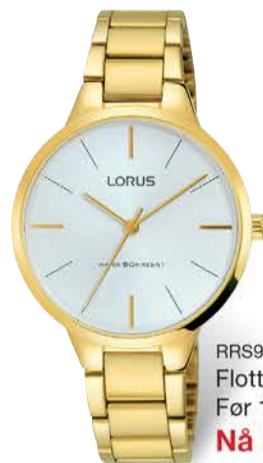
RRS98VX9 Flott dameur Før 1 198,- Nå kr 598,-