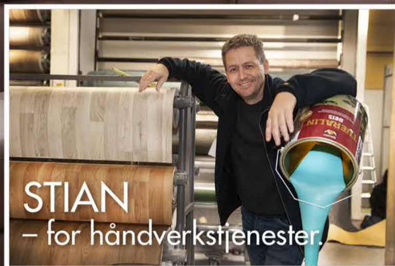
STIAN – for håndverkstjenester.

Ute eller inne. La oss på Beleggsenteret hjelp deg til å skape den gode hjemmefølelsen. Vi kan vårt fag.