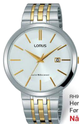
RH915JX9 Herre to-farget Før 1 198,- Nå kr 598,-