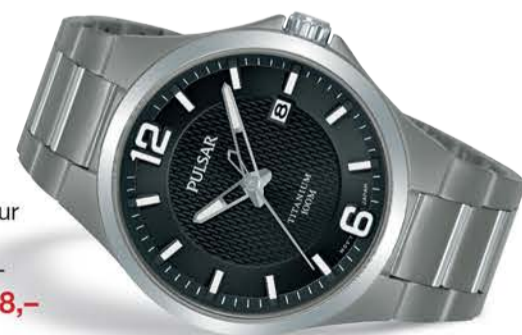
PS9613X1 Titan herreur 100m Før 1 998,- Nå kr 998,-