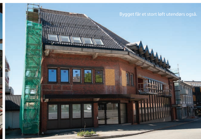
Bygget får et stort løft utendørs også.