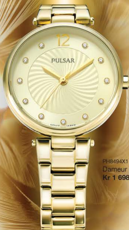
PH8494X1 Dameur med krystaller Kr 1 698,-