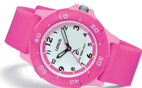
RRX17GX9 Fargerikt barneur 100m Før 498,- Nå kr 249,-