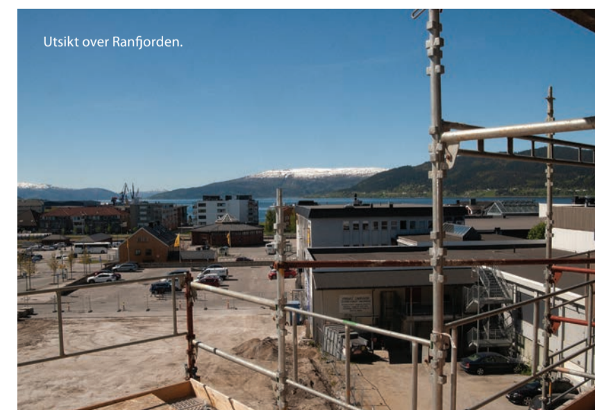
Utsikt over Ranfjorden.

VISNING For å avtale visning, kontakt med eiendomsmegler Susanne Møgster Dahle hos REDE eiendomsmegling.