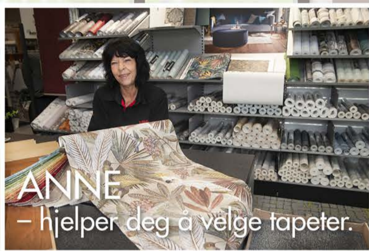
ANNE – hjelper deg å velge tapeter.