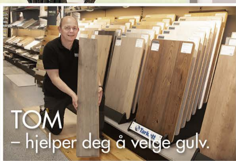
TOM – hjelper deg å velge gulv.