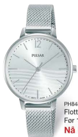
PH8483X1 Flott dameur Før 1 398,- Nå kr 698,-