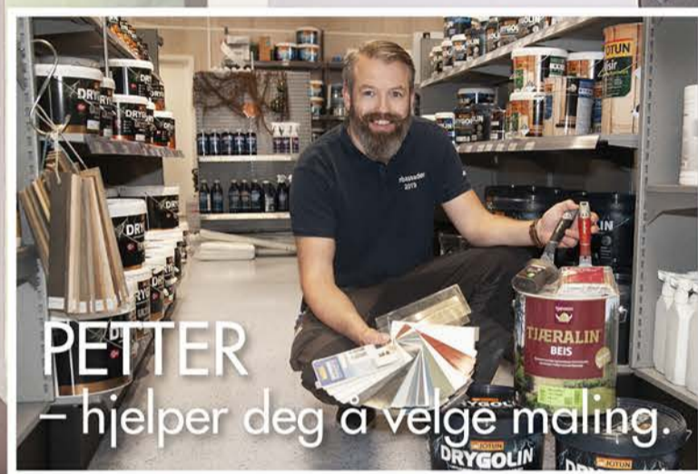
PETTER – hjelper deg å velge maling.