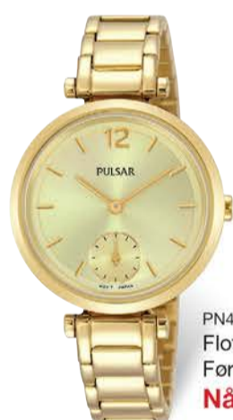
PN4068X1 Flott dameur Før 1 798,- Nå kr 898,-