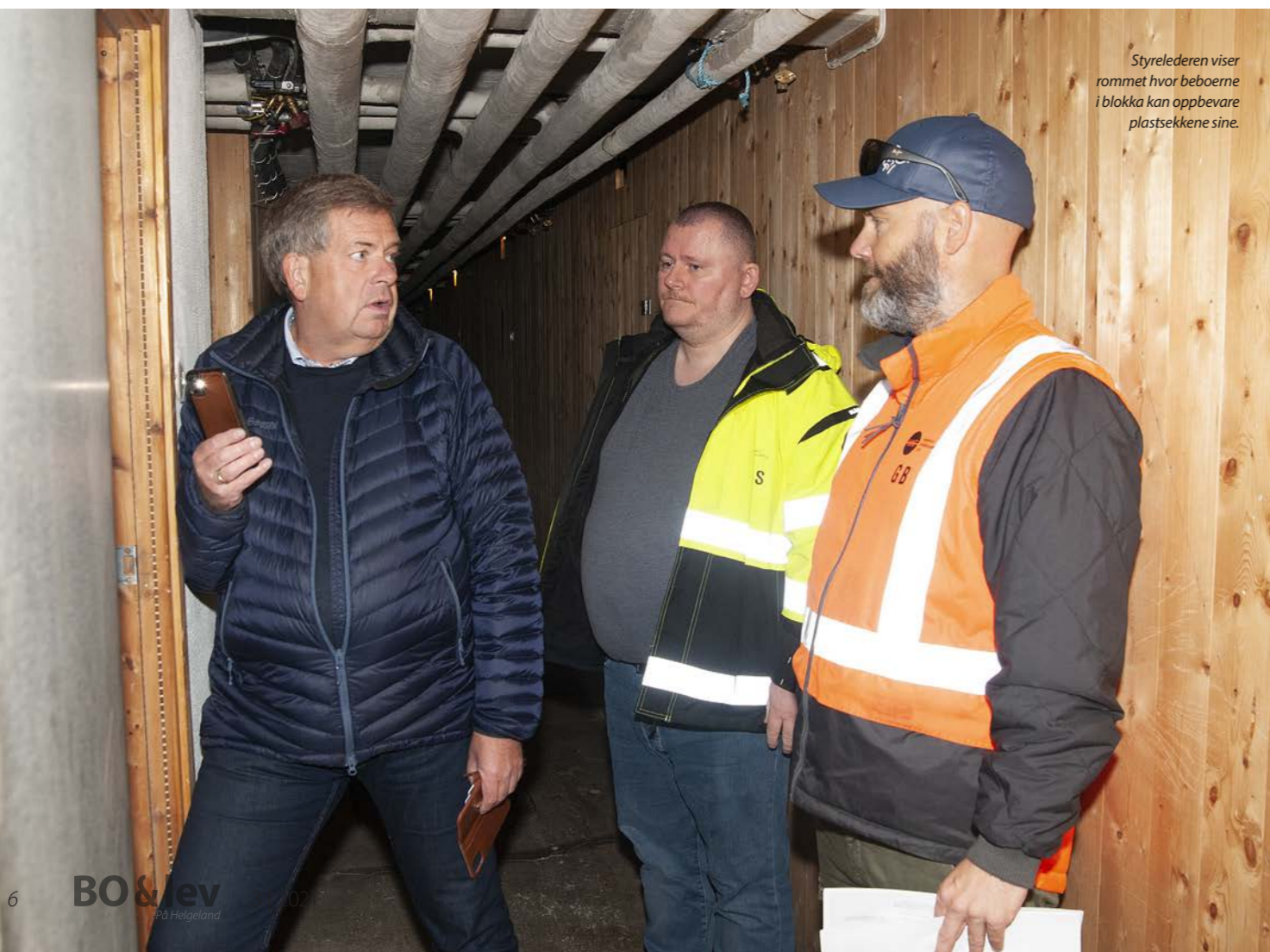
Styrelederen viser rommet hvor beboerne i blokk kan oppbevare plastsekkene sine.