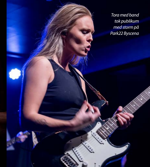
Tora med band tok publikum med storm på Park22 Byscena