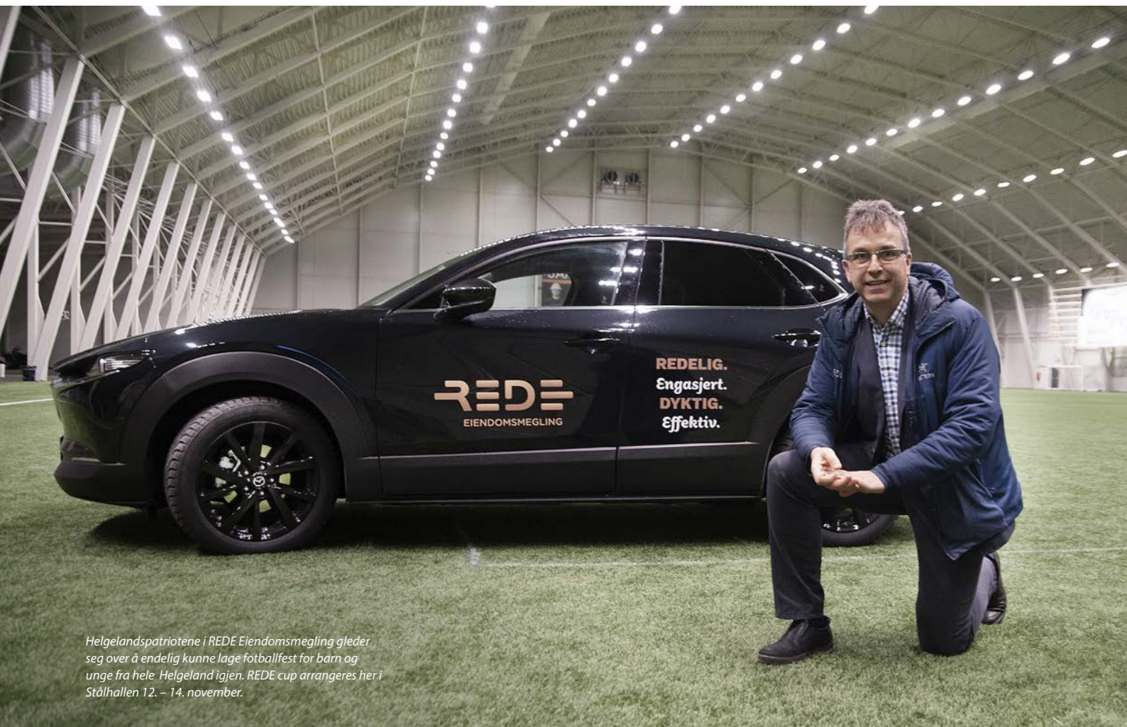
Helgelandspatriotene i REDE Eiendomsmegling gleder seg over å endelig kunne lage fotballfest for barn og unge fra hele Helgeland igjen. REDE cup arrangeres her i Stålhallen 12. - 14. november.

REDE cup arrangeres i Stålhallen i Mo i Rana 12. - 14. november.